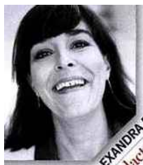
PAR ALEXANDRA RAILLAN rédactrice en chef beauté